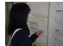
文化祭防災アンケート