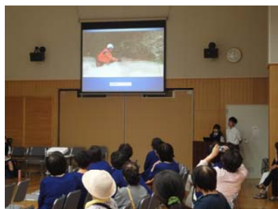
むらさきかんフェスタ