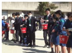
岡崎市藤川西部町内会総合防災訓練 取材 (参加)