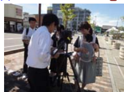
防災・AEDアンケート